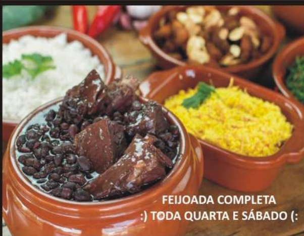
FEIJOADA COMPLETA :) TODA QUARTA E SÁBADO (: