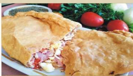
Tradicional Calzone do Beppe & Pizza Frita

Faça seu evento ou confraternização no Beppe Amplio Salão | Adega de vinhos Espaço Kids Temos Chopp Heineken